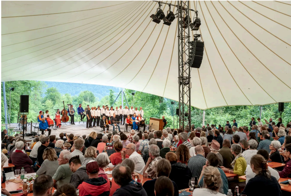
Volkskulturfest Obwald in der Lichtung Gsang in Giswil.

(Giswil, 30. 6. 2024)