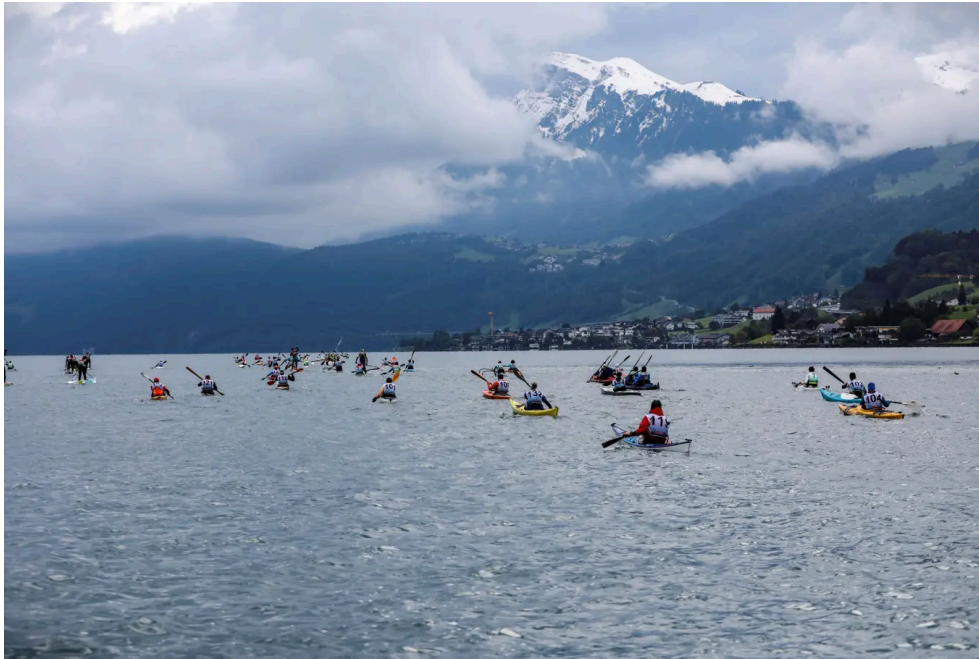
Kanu-Marathon in Buochs.